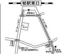
歩行者天国規制時の運行経路図

10:00~18:00までの時間帯は歩行者天国規制のため、柏駅入口は通りません。柏駅東口長台寺(休日用)をご利用下さい。